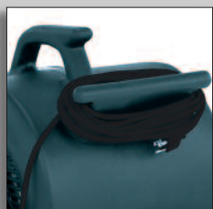
Facil de transportar