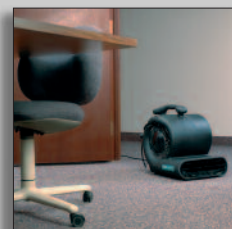
Máquina en acción