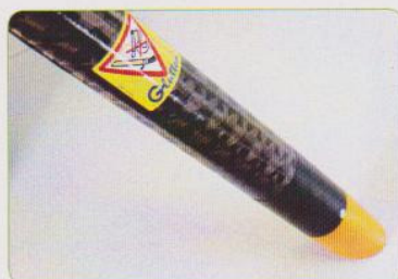
Tobera de carbono extraligera con apoyabrazos