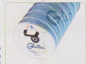
Filtro antipolvo de 18 m 2