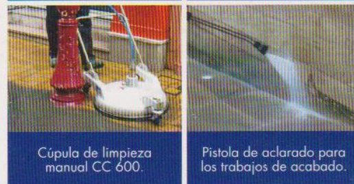
Cúpula de limpieza manual CC 600.