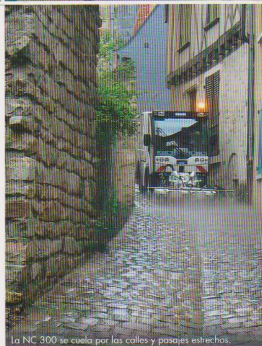
La NC 300 se cuela por las calles y pasajes estrechos.