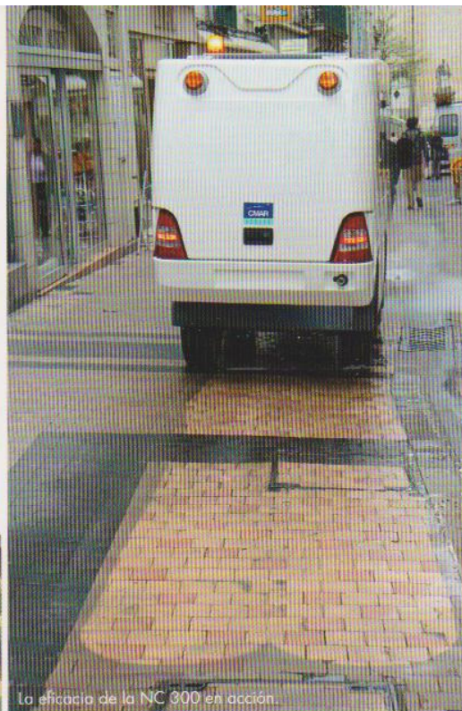
La eficacia de la NC 300 en acción.