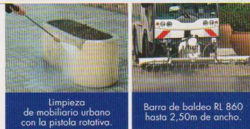
Limpeza de mobiliario urbano con la pistola rotativa.