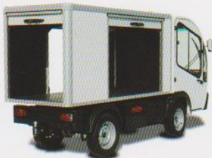
Furgón persiana lateral

Con un volumen de carga que puede alcanzar los 4 m 3 , la versión furgón del G3 es muy polivalente. Sus persianas ofrecen una amplia accesibilidad en el furgón y su ergonomía es muy apreciada en las aplicaciones con paradas frecuentes.